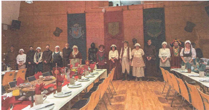
Magd und Knecht machten drei Tafeln zurecht, der GONGER kündigte den nächsten Gang an; so mancher wurde in den KERKER gesteckt...