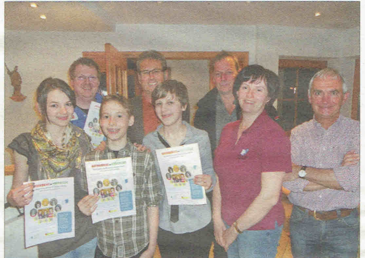
Obmann der Heimatbühne Kirchdorf, Autorin und Ehrengäste freuen sich mit den Darstellern auf die Premiere „Rattenschwanz und Schütteltanz“.